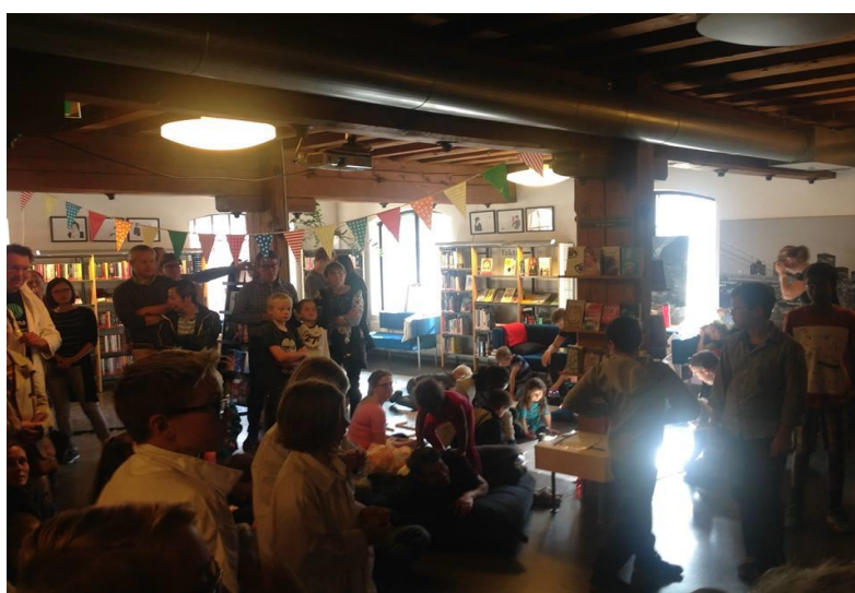
Bilde 4 Utforskeren Moss bibliotek i september