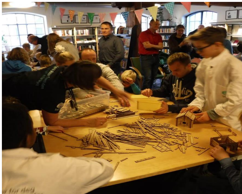
Bilde 6 Macker space og programmering i november på Moss bibliotek