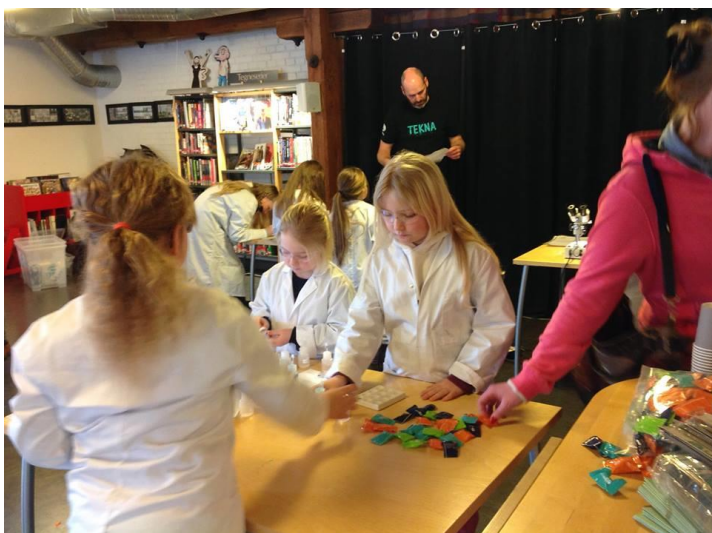
Bilde 2 Kjøkkenkjemi: Blander litt den med litt av det så blir det noe nytt