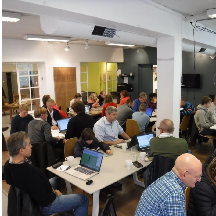
Bilde 7 Droneverksted på Verket FabLab i november