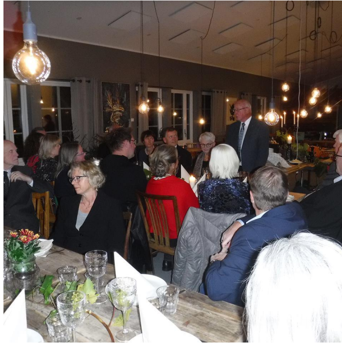
Bilde 5 Høstfest på Røed Gård i oktober