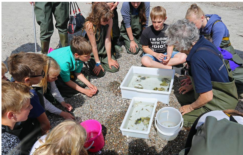
Bilde 1 Tur til Tjärnö forskningsstasjon i juni