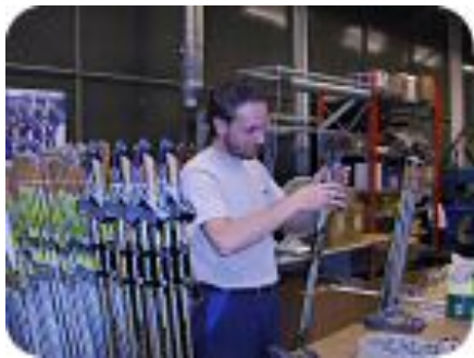
Fra Madshus på Biri

Utover egne avdelingsarrangementer har avdelingene rundt Mjøsa invitert hverandre gjensidig til åpne arrangementer, og medlemmer fra Lillehammer har deltatt på bedriftsbesøk i Hedmark og Gjøvik avdelings regi.