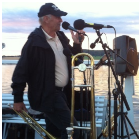
Glajazz på Mjøsa