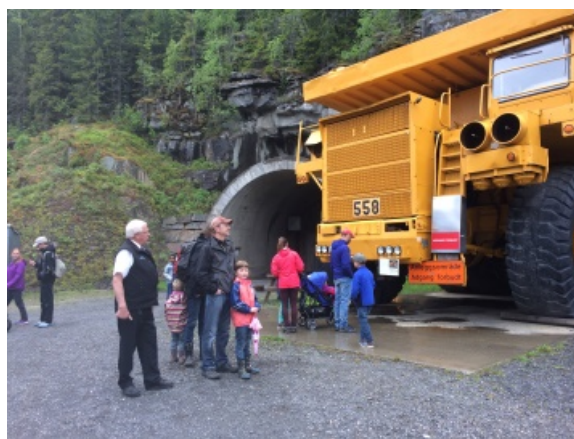
Store maskiner på Norsk Vegmuseum