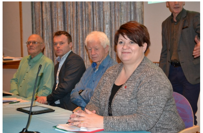
Mjøsordførerne i paneldebatt om jernbane