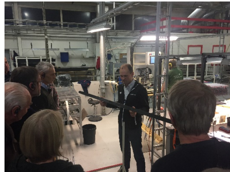
Dir. Rune Abrahamsen, Moelven Limtre