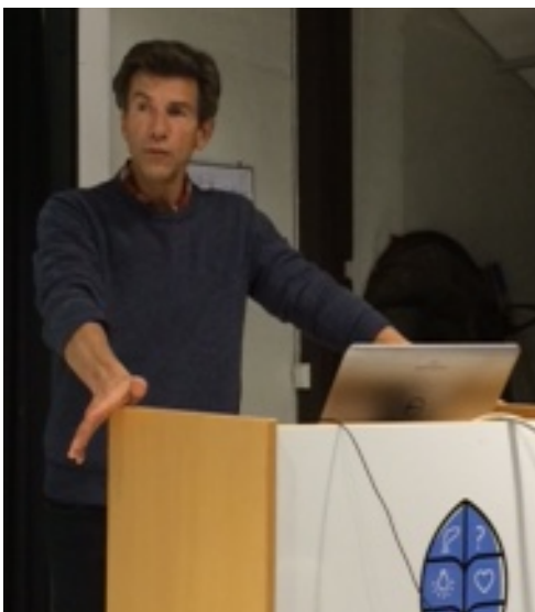
Dag Hessen om klima