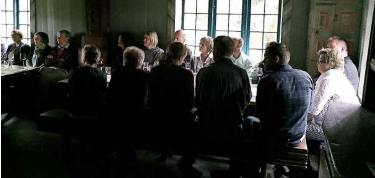
Figur 4 Deltagere på vinkurs

Avdelingens aktiviteter/tiltak er presentert med utgangspunkt i målsetningene i Teknas overordnede strategi, Tekna 2020 .