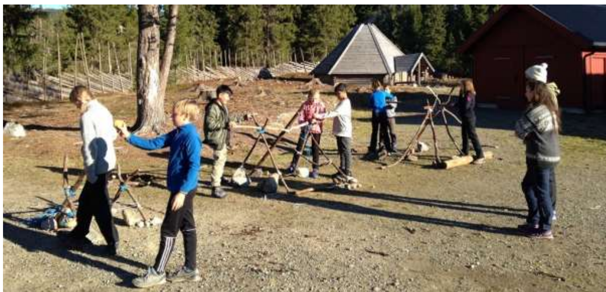
Figur 5 Ivrigte deltagere på Newton Camp.

Hamar og Hedemarken Turistforening (HHT) og Tekna Hedmark avdeling arrangerte i Newton Camp for første gang i 2009. Siden har dette blitt en vellykket tradisjon som avholdes i høstferieuka på leirstedet Skolla i Åstdalen i Ringsaker.