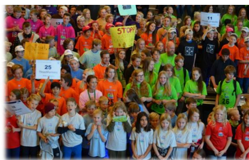
Lokale sponsorer for FLL Agder 2015:

FLL Agder sto i 2015 for 9. året som arrangør av den regionale finalen i FIRST LEGO League for lag fra Agder-fylkene. I tillegg til det ordinære arrangementet, har vi også for 5. gang arrangert Jr. FLL - en turnering for barn i aldersgruppen 6 – 9 år. Universitetet i Agder, Grimstad, har på nytt vært turneringssted. Årets 26 påmeldte lag i FLL har fordelt seg på 17 ungdomsskolelag og 9 barneskolelag, 17 lag fra Vest-Agder og 9 fra Aust-Agder. Til Jr. FLL stoppet ikke påmeldingen før vi var oppe i 22 lag. Årets to oppdrag hadde fått titlene ”Trash Trek” (FLL) og ”Waste Wise” (Jr. FLL). Begge oppdragene omhandlet søppel og hvordan vi skal løse fremtidens utfordringer på søppelfronten.