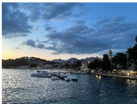
Figur 4 Bilde fra Cavtat.

Den første dagen ble avsluttet på en restaurant i sentrum av byen Cavtat.