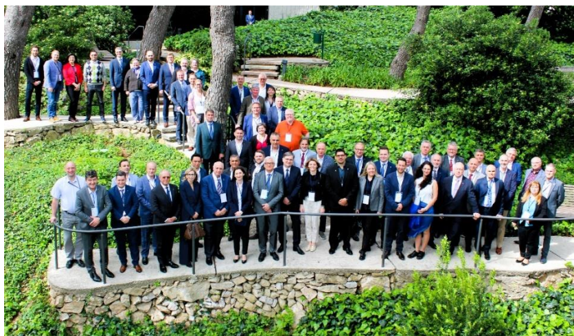
Figur 6 Årets deltakere på CLGE møtet i Cavtat, Kroatia

Som en kuriositet kan det opplyses om at gamlebyen i Dubrovnik ble brukt som kulisse i forbindelse med innspillingen av Games of Thrones. Det var dette som var Kings Landing.