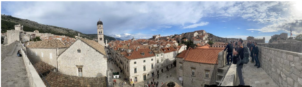
Figur 5 Utsnitt av Dubrovnik tatt fra muren rundt gamlebyen

Etter avslutningen av møtet var det en stor gruppe av deltakerne som dro til Dubrovnik med felles buss. Der hadde vi en byrundtur med en lokal guide som fortalte om utviklingen av Dubrovnik fra den ble grunnlagt til dagens by. Vi hadde også en spasertur på festningen rundt gamlebyen. Noe av det kjekkeste vi opplevde var to lokale bryllup og kroatiske skikker knyttet til dette. Her var det sang og dans før vielsen, og mens bruddefølget ventet på brudeparet i forbindelse med fotografering på en lokal bar/restaurant og når de gikk gjennom byen på vei til bryllupsfesten.