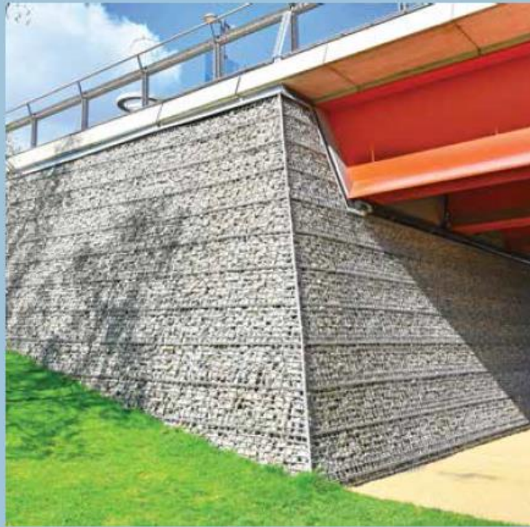
Gabionvegg i knust betong