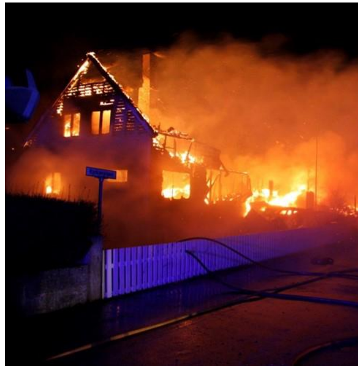
Illustrasjon fra Bygg og Bevar